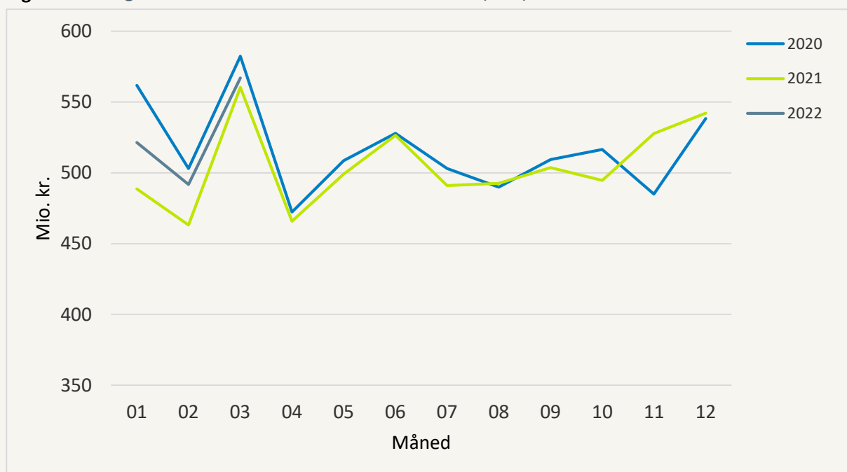
Figur 2: Udgifter til medicintilskud for de seneste 3 år (ÅTD)

Den samlede tilskudsberettigede omsætning i 1. kvartal 2022 (ÅTD) beløber sig til 2.535 mio. kr. Heraf udgør regionernes udgifter til medicintilskud 1.580 mio. kr. Det giver en gennemsnitlig regional tilskudsprocent på 62,3 pct.