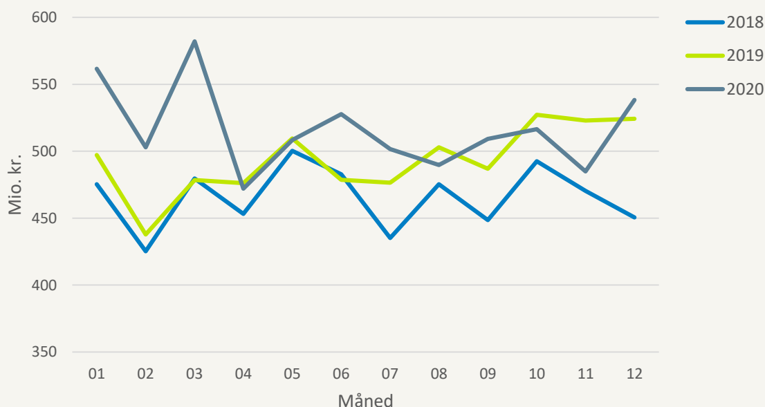
Figur 2: Udgifter til medicintilskud for de seneste 3 år (ÅTD)

Den samlede tilskudsberettigede omsætning i 4. kvartal 2020 (ÅTD) beløber sig til 9.889 mio. kr. Heraf udgør regionernes udgifter til medicintilskud 6.195 mio. kr. Det giver en gennemsnitlig regional tilskudsprocent på 62,7 pct.