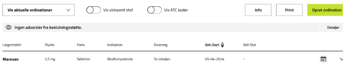
Figur 1 - Medicinoversigten uden advarsler